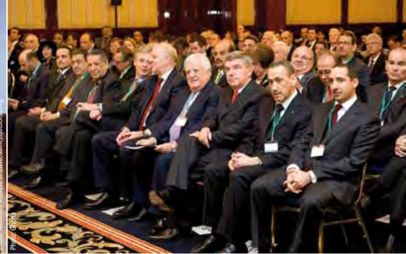
Das Deutsch-Arabische Wirtschaftsforum 2010 in Berlin von Ghorfa und DIHK: Eine Plattform für die Anbahnung von Geschäften. The German-Arab Economic Forum 2010 in Berlin staged by Ghorfa and DIHK : a platform for establishing business contacts.

Eine ähnliche Entwicklung erwarten wir für andere Länder. Einige Projekte mögen sich kurzfristig verzögern. Mittel- bis langfristig gehen wir von positiven Impulsen für die geschäftlichen Beziehungen aus.